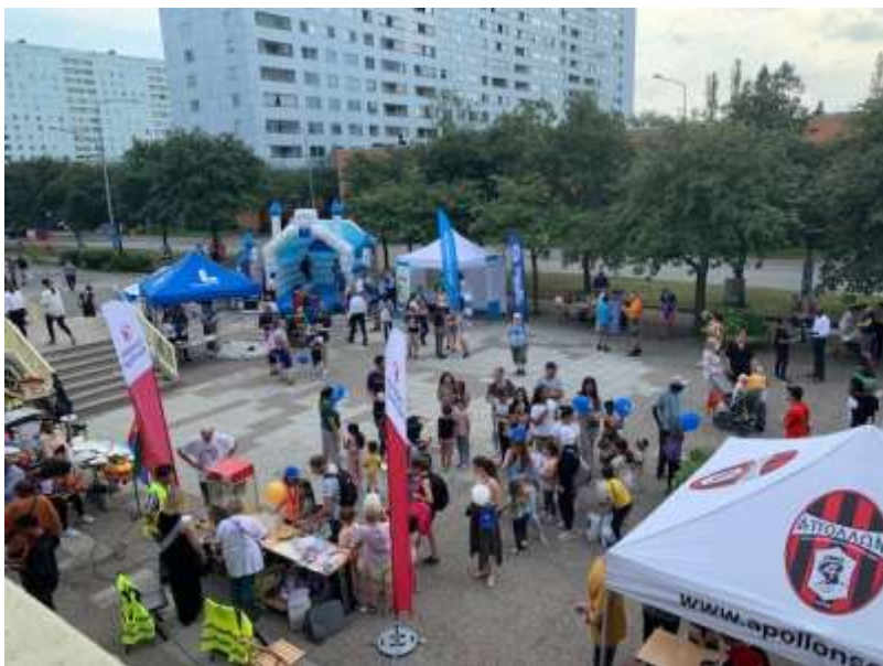
Full fart på torget under Hagalundsdagen.

Årets Hagalundare var Hagalunds Bigård. Med motiveringen ”För att ha omvandlat en otillgänglig del av Hagalund till en oas, Bi dragit till den Bi ologiska mångfalden och för ert stora engagemang för barn och unga”.