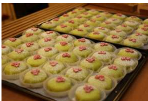
Det bjöds på Pizza och festliga bakelser