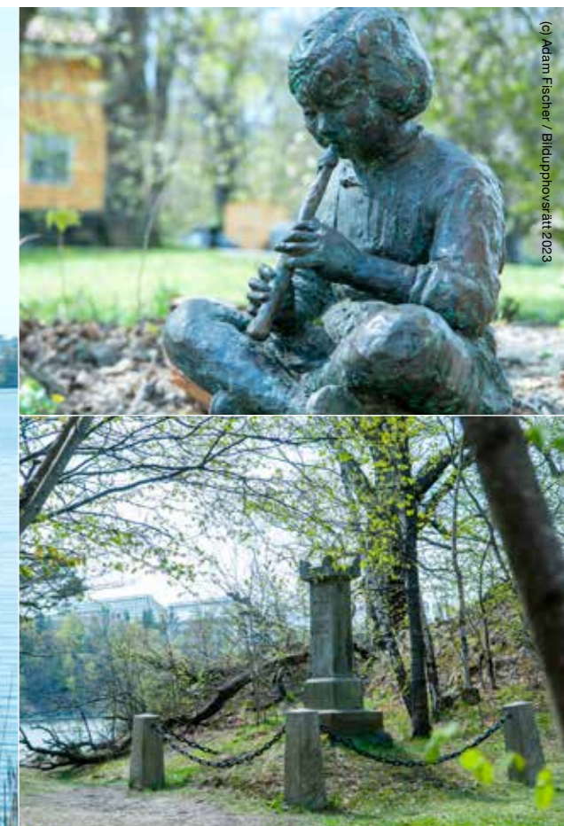
(9) Adam Fischer / Bildupphovsätt 2023