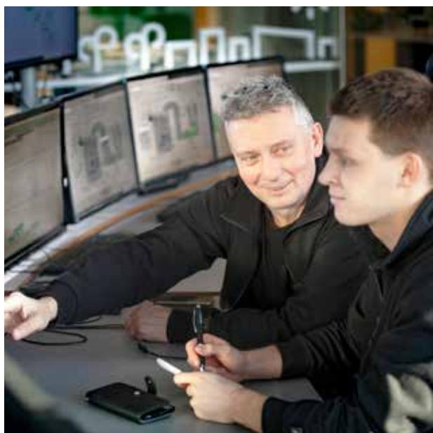
Från Solnaverkets kontrollrum styr Norrenergis driftpersonal värmen. Varmt vatten strömmas ut i rör under marken och värmer 90 procent av fastigheterna i Solna.

Uppvärmningen av bostäder har stor betydelse för klimatet. I Solna värms nio av tio fastigheter upp med hjälp av Norrenergis fjärrvärme. Övergången till förnybar värme har bidragit och fortsätter att bidra till minskade växthusgasutsläpp i Solna.