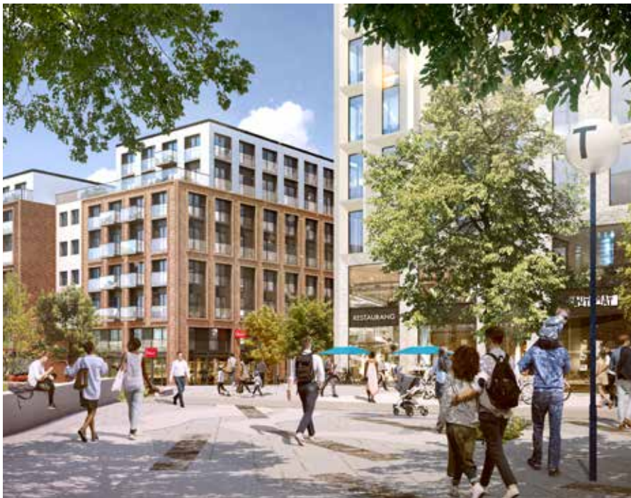
Ny bebyggelse längs Dalvägen. Tunnelbanetorg och nytt kvarter med bostäder. Illustration: BAU