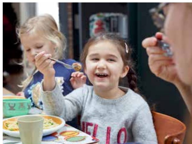
Bilden är ej från Hannebergs förskola.

Utomhusleken kombineras också gärna med kretsloppstänkande, bland annat genom odling av egna grönsaker på förskolans område. Det är extra spännande att få smaka av det man själv varit med och odlat! De återkommande skräpplockardagarna är en annan verksamhet som gör barnen miljömedvetna på ett otvunget sätt, och ger dem goda förutsättningar att fortsätta bidra till Solna som en klimatneutral stad i framtiden.