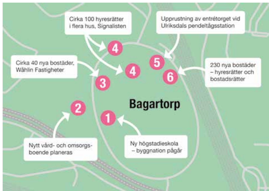
Pågående och planerade utvecklingsprojekt i Bagartorp.

Befolkningsprognosen visar att antalet äldre i Solna kommer att vara relativt stabilt under de närmaste fem åren för att därefter börja öka. För att möta behovet kommer Solna att behöva ytterligare två vård- och omsorgsboenden under de kommande tio åren – och det första av dem planeras just i Bagartorp. Inriktning är att boendet ska byggas på ett markområde väster om Bagartorpsringen, parallellt med den nya högstadieskolan. Stadsledningsförvaltningen har fått i uppdrag av kommunstyrelsen att ta fram en principöverenskommelse mellan staden och Bostadsstiftelsen Signalisten om det nya vård- och omsorgsboendet.