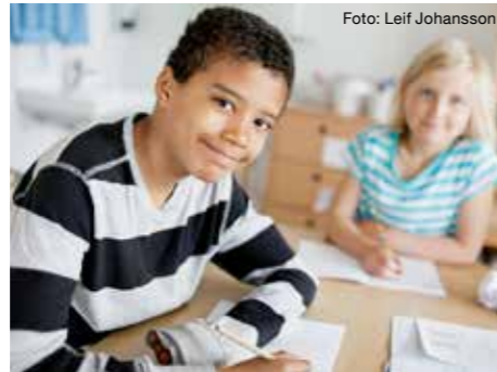
Högre kunskapsresultat i Solna skolor med högre meritvärde.