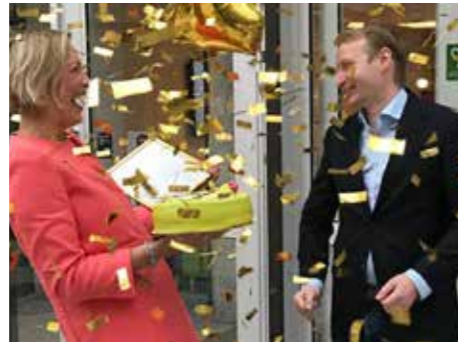
Sveriges bästa företagskommun – tolv år i rad.