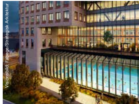
Solnas nya simhall börjar byggas.