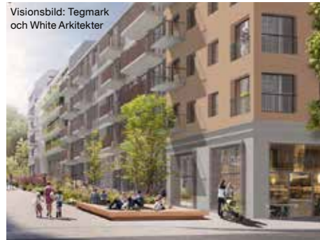
4 000 nya lägenheter i Järvastaden.