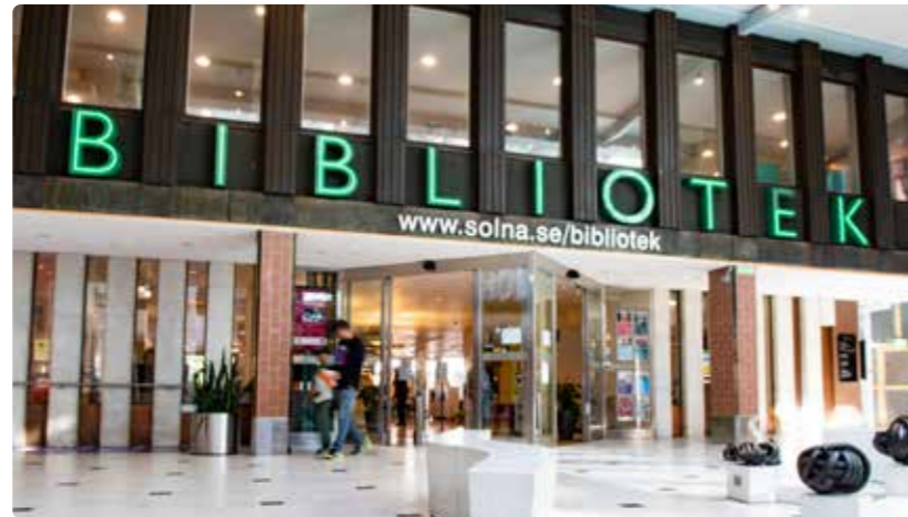
Etableringstrappan finns på biblioteket i Solna centrum med representanter från Solna stad på plats.