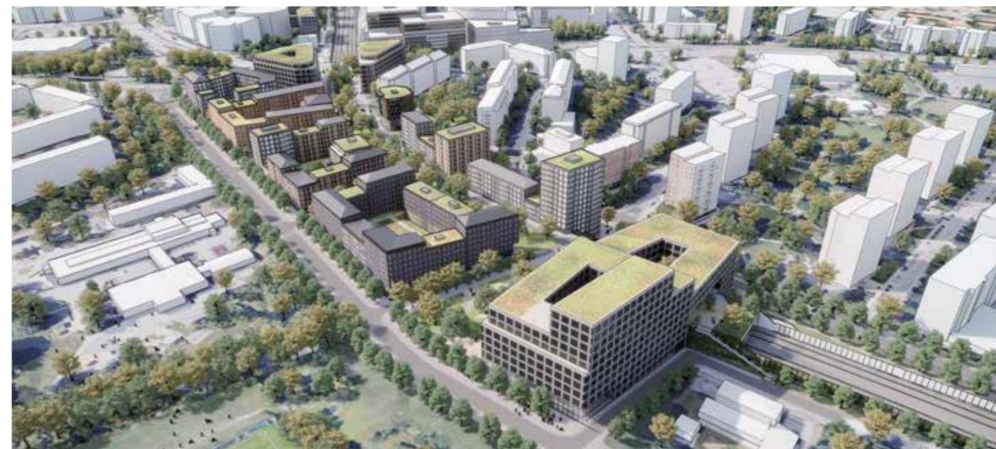
Stadsbebyggelse längs överdäckningen av Mälardalen. Illustration: AIX Arkitekter

Byggnadsnämnden beslutade den 3 februari att miljö- och byggnadsförvaltningen ska genomföra samråd om detaljplanen. Samrådsperioden är mellan 3 mars och 2 maj 2021. Digitala samrådsmöten genomförs den 25 mars och 15 april. Läs mer på solna.se/malardalen