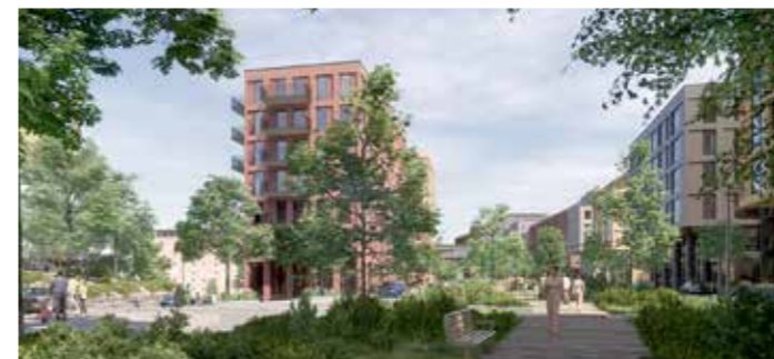
Tusen bostäder planeras i nya gröna stadskvarter. Illustration: AIX Arkitekter