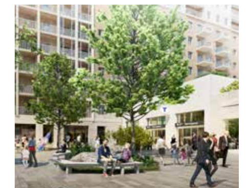
Ny tunnelbanestation: Södra Hagalund. Illustration: BSK Arkitekter