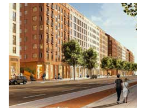
Nya bostadskvarter vid Solna centrum. Illustration: BAU