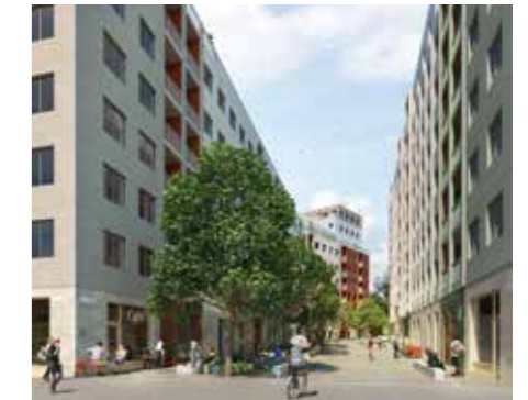
Nya stadskvarter vid Södra Hagalund. Illustration: BSK Arkitekter