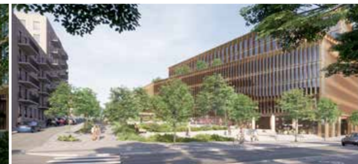
Bebyggelse på mark som frigörs när järnväg förläggs i tunnel. Illustration: AIX Arkitekter