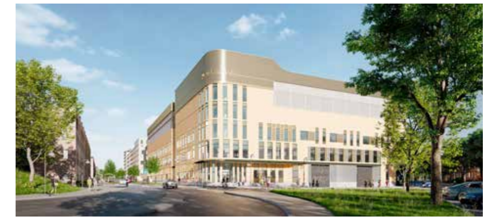
Nya skolan i Huvudsta. Vy från Armégatan strax väster om planområdet. Illustration: Pavel Vavilov Studio

Byggnadsnämnden beslutade den 3 februari 2021 att samråd ska genomföras om detaljplanen för en ny skola i Huvudsta. Samrådsperioden är mellan 24 februari och 11 april. För mer information se solna.se/blamesen