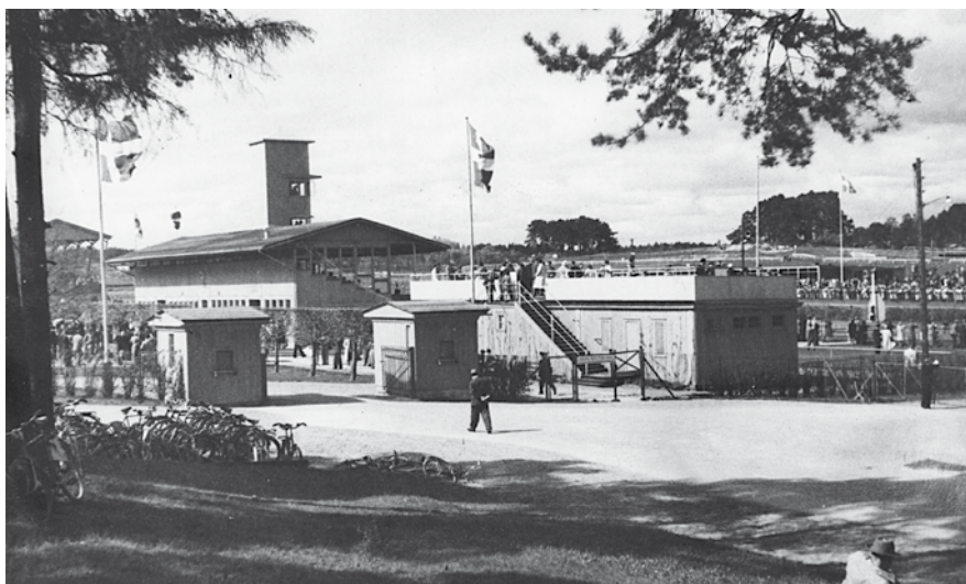
Den tidigare galoppbanan i Ulriksdal.

I Ulriksdal växer en ny stadsdel fram på historisk mark, som tidigare har varit både militär övningsplats och galoppbana. Området fylls med liv igen med nya bostäder och till hösten öppnar nybyggda Ulriksdalsskolan.