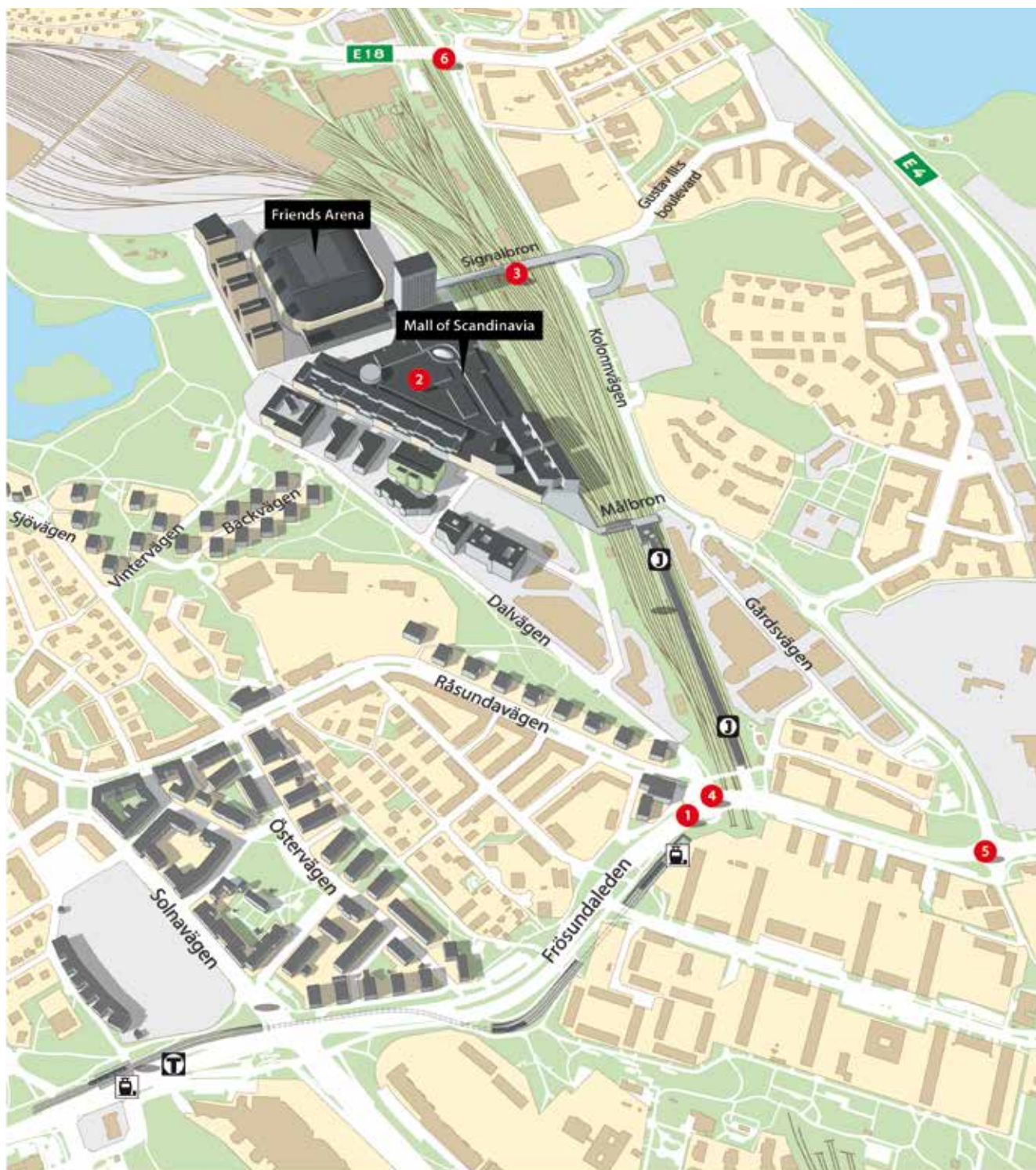
Illustration: Tomas Öhrling

För att förbättra framkomligheten byggs Frösundaleden om. Arbetet sker i tre etapper och ska vara helt klart hösten 2015. Under byggtiden är Frösundaledens framkomlighet begränsad.