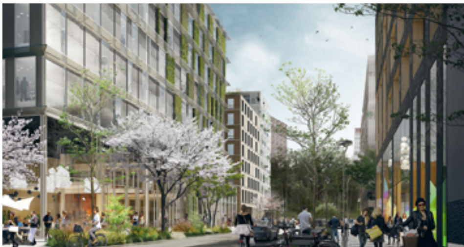
Visionsbild: "Mellangatan" White arkitekter.

Även PEAB har fått bygglov för sitt nya huvudkontor. Den åtta våningar höga kontorsbyggnaden blir huvudkontor för PEAB och blir en av de fem byggnader, som planeras i det blivande kvarteret Sadelplatsen, som byggs längs E4:an i Nya Ulriksdal.