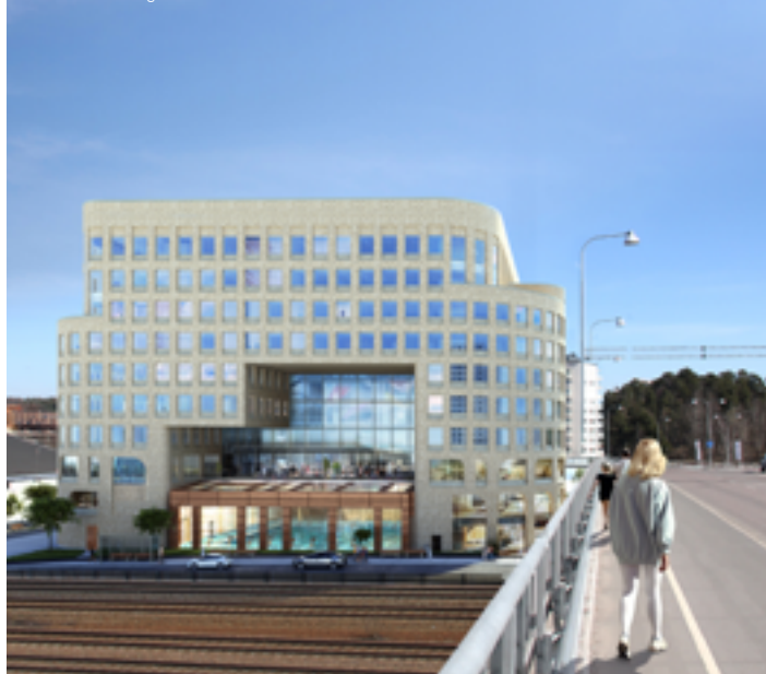
Vy från Signalbron. Visionsbild: Strategisk Arkitektur

Arbetet med Solnas nya simhall pågår som bäst. Planen är att solnaborna kan ta sina första simtag i bassängerna under 2020. Simhallen byggs på Ulriksdals IP, bredvid ishallarna endast ett stenkast från Arenastaden och dess utmärkta kommunikationer.