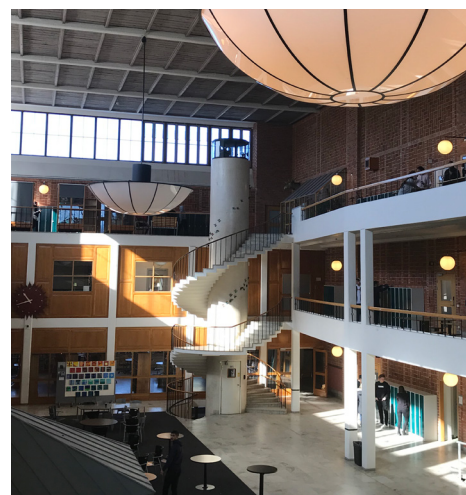
Solna Gymnasiums aula.

Utöver åtta olika nationella program och inriktningar erbjuder skolan nationell idrotts-