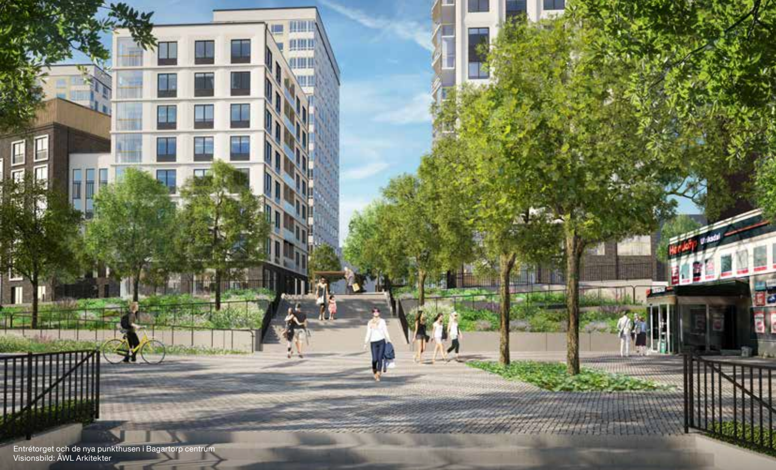
Entrétorget och de nya punkthusen i Bagartorp centrum Visionsbild: ÅWL Arkitekter