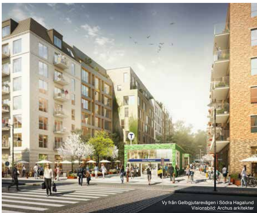
Vy från Gelbgjutarevägen i Södra Hagalund Visionsbild: Archus arkitekter

Hagalunds arbetsplatsområde omvandlas till en levande stadsmiljö med en blandning av bostäder och arbetsplatser. Nu startar första etappen i utvecklingen av området med ny bebyggelse i direkt anslutning till den nya tunnelbanestationen i södra Hagalund. Projektet bidrar också till stadens finansiering av den nya tunnelbanan till Arenastaden.