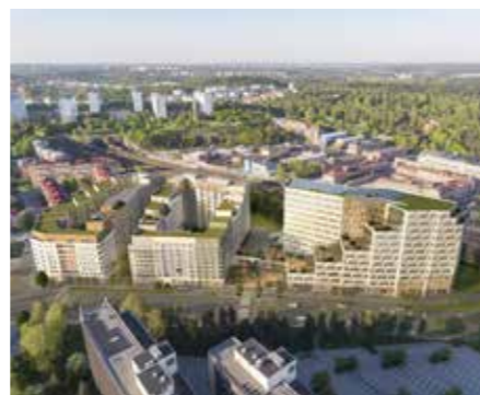
Vy snett uppifrån, från andra sidan Solnavägen. Illustration: BSK Arkitekter