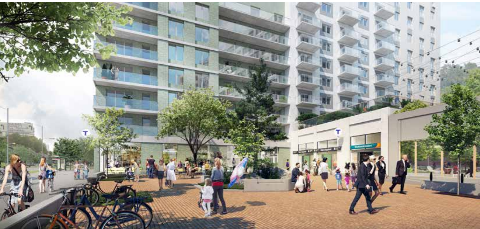
Vy över torg mot tunnelbana och nya bostäder. Illustration: BSK Arkitekter