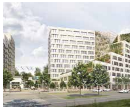
Vy mot torg och tunnelbana från andra sidan Solnavägen. Illustration: BSK Arkitekter

Byggnadsnämnden beslutade den 18 september att ge miljö- och byggnadsförvaltningen i uppdrag att genomföra samråd om detaljplanen. Samrådsmötet ägde rum den 23 oktober på Solna stadsbibliotek. Mer information finns på solna.se