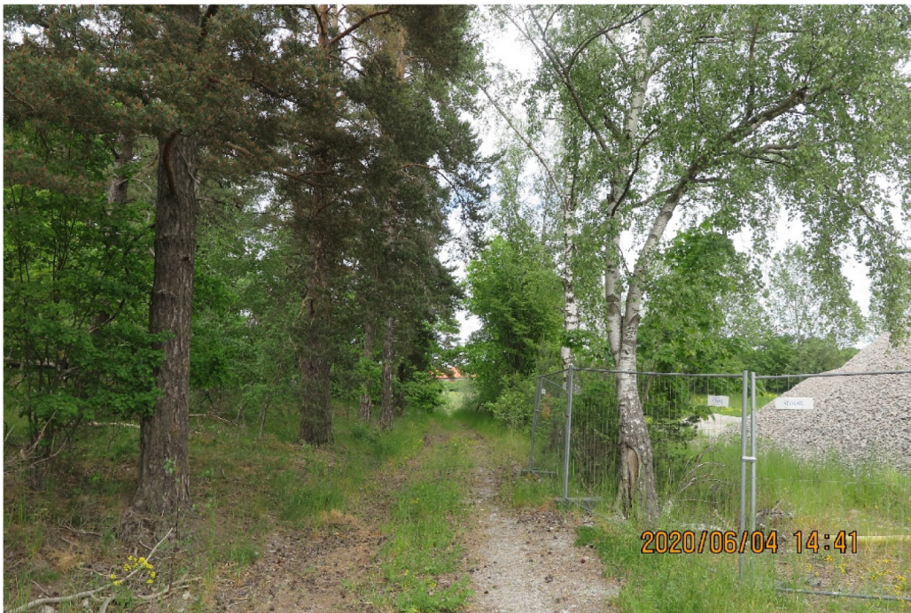
Bild 3: Naturreservatets trädbestånd till vänster, servicevägen i mitten. Till höger området där sportanläggningen är planerad. Höger intill vägen en björk med gamla skador.

Träden vänster om vägen, som är av trädslag tall Pinus sylvestris , bedöms som friska och stabila i nuläget, utan synliga strukturella defekter. På andra sidan vägen, mot den planerade sportanläggningen, står det två björkar (varav den ena med omfattande stamskada och stamröta) samt en mindre ek.