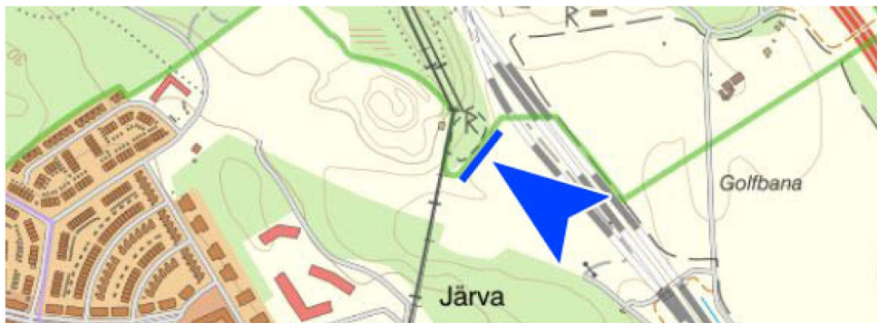
Bild 1: Kartutsnitt med naturreservatet i norr och Järvastadens område i syd. Utländat avser den blå sträckningen.