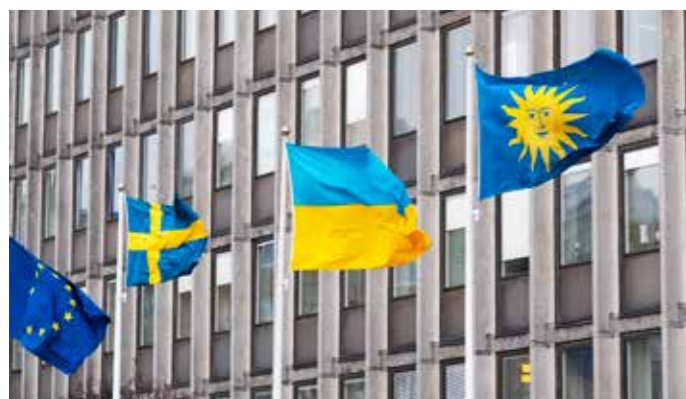
Ukrainska flaggan vajar utanför Solna stadshus.

Den 24 februari inledde Ryssland sitt väpnade angrepp mot Ukraina. Ukraina slåss för att försvara sin demokrati och frihet och Sverige har tillsammans med övriga EU slutit upp bakom Ukraina. Solna stad har sedan krigsutbrottet arbetat för att säkerställa beredskap för att möta konsekvenserna av kriget för Solna. Det handlar framför allt om att kunna ta emot de som befinner sig på flykt.