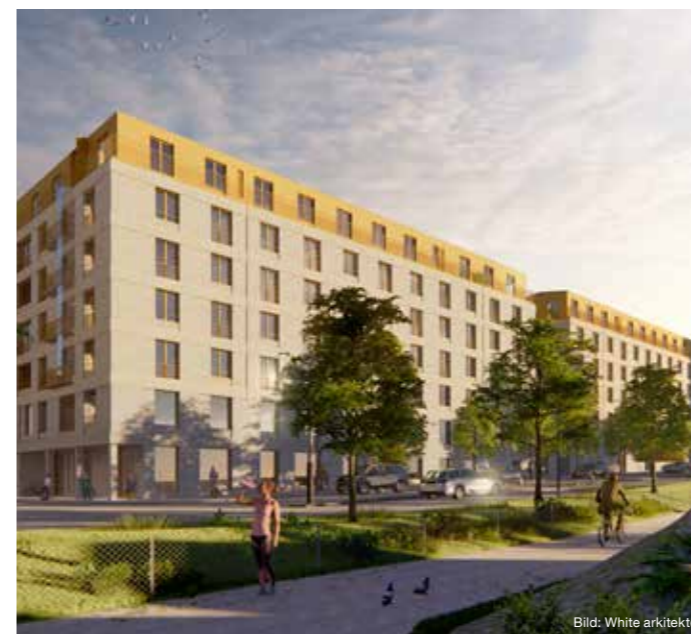
Nya hyresrätter i kvarteret Turkosen. Vy sett från nordväst mot Huvudstagatan/Hannebergsgatan.

Cirka 80 hyresrätter kommer att byggas i centrala Solna. Byggnadsnämnden beslutade i maj att genomföra samråd om detaljplanen, som möjliggör för Bostadsstiftelsen Signalisten att bygga de nya lägenheterna.