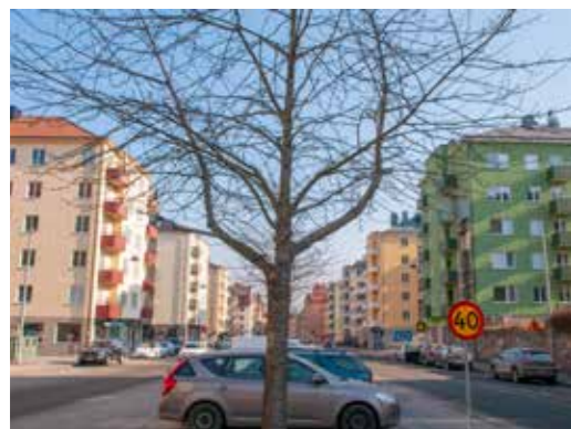
Råsundavägen har varit en viktig utgångspunkt för programmet, eftersom den är ett gott exempel på en sammanhållen stadsmiljö.

Programmet ska kunna användas som inspiration och stöd i såväl tidiga skeden som vid framtagande av detaljplaner och bygglovs- prövning. Programmet bygger på fyra principer, som ska kunna fungera som en slags checklista vid nybyggnation, med målet att skapa en fin arkitektur med tilltalande rumsbildningar och en varierad livsmiljö för Solnaborna. Råsunda- vägen har varit en viktig utgångspunkt för programmet, eftersom den är ett gott exempel på en sammanhållen stadsmiljö av hög klass, trots olika byggstilar.