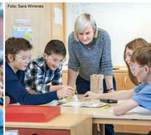
Lärarna får mer tid till undervisning.