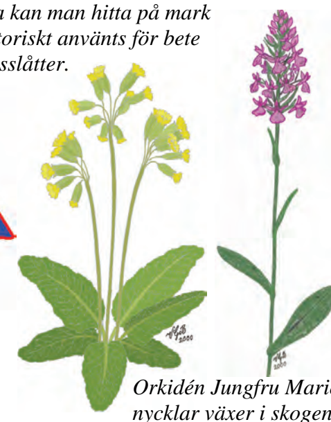
Orkidén Jungfru Marie nycklar växer i skogen.

Gullviva kan man hitta på mark som historiskt använts för bete och ängsslätter.