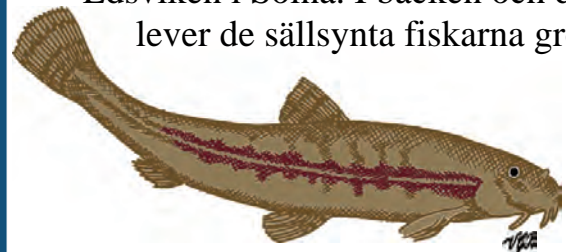
Grönling trivs i strömmande vatten.

Igelbäcken rinner från Säbysjön i Järfälla till Edsviken i Solna. I bäcken och dess utlopp lever de sällsynta fiskarna grönling och nissöga.