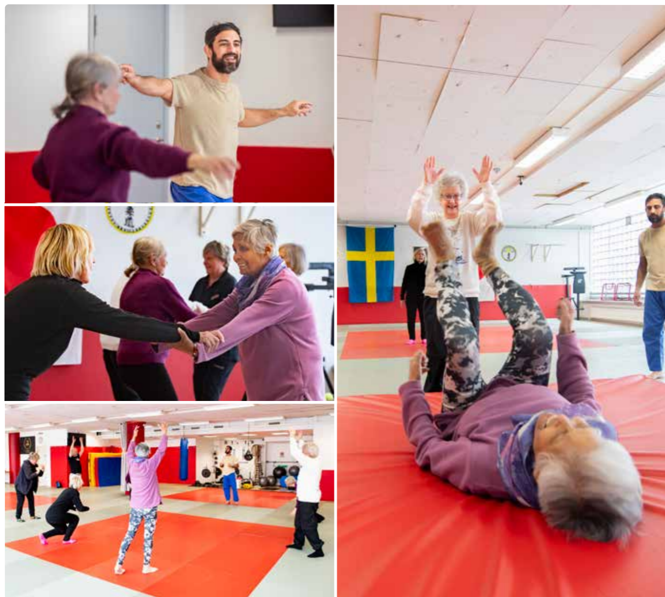
Deltagarna i Judo4Balance övar balans och lär sig falla rätt – och har dessutom roligt under tiden.