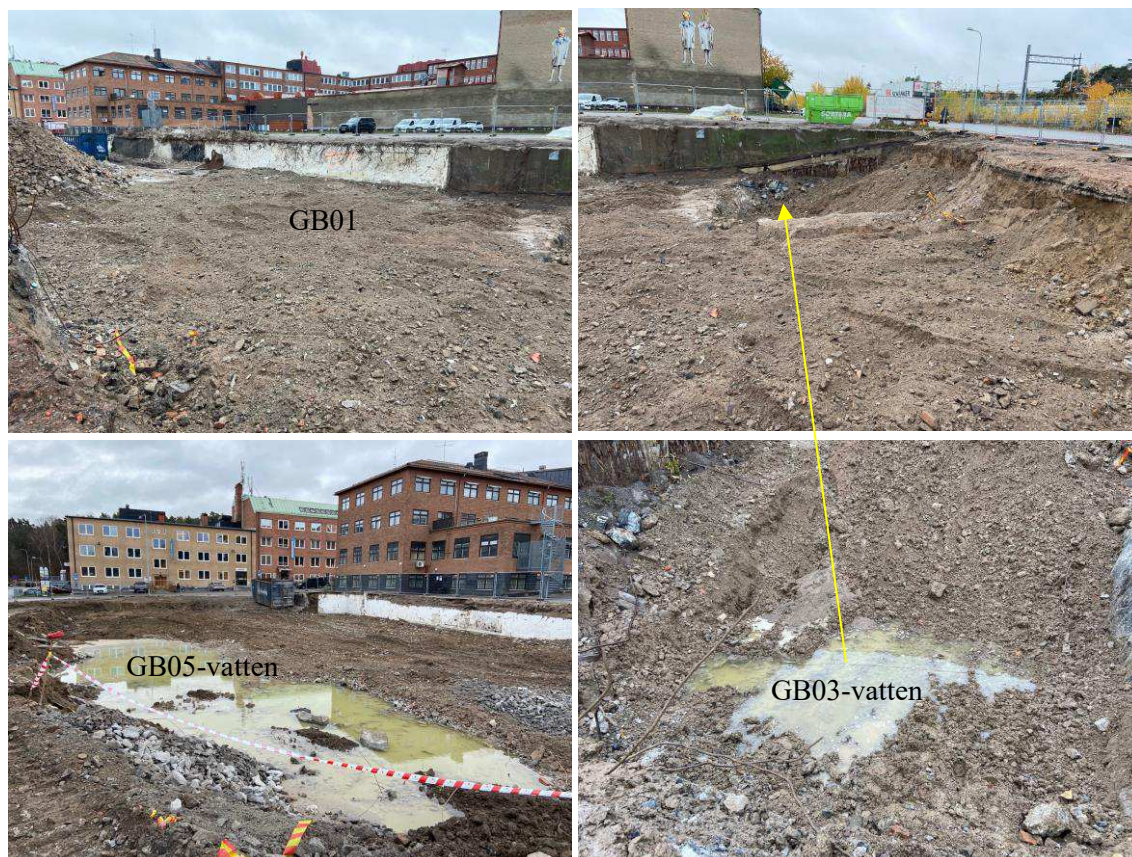
Figur 3. Bilder från mark- och vattenprovtagning - Schaktbotten inom Gelbgjutaren 13.

Analysresultaten på vattnet i schaktgroparna redovisas i bilaga 2d och i plan i bilaga 1b (tillsammans med grundvattenanalyserna) även om vattnet mer är av ytvatten-/markvattenkaraktär än grundvatten. Dvs, det bedöms inte vara ett vatten från ett grundvattenmagasin. Vattenproverna klarar i sak dricksvattennormerna även om det inte skall drickas. Anledningen till att vattenprovet ändå redovisas är att klorerade ämnen detekteras om än i låga haltnivåer, liknande de haltnivåer som för grundvattenproverna där klorerade lösningsmedel detekterats.