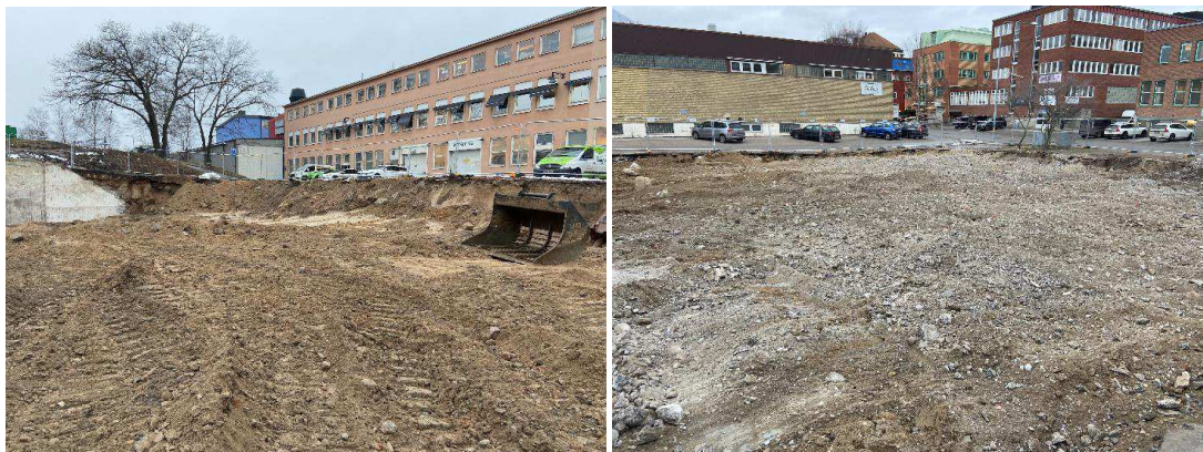
Figur 4. Bilder från markprovtagning - Schaktbotten inom Instrumentet 5. Norra delen (vänstra bilden=, södra delen (högra bilden).