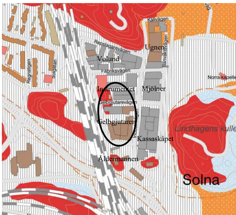
Figur 1. Geologisk karta (SGU). Ungefärligt området för planområdet markeras med svart cirkel.

Enligt Golder 2020 (geoteknisk utredning för Hagalunds industriområde/Detaljplan för Gelbgjutaren, Instrumentet 5 mfl) finns en vattendelare som motverkar vattenrörelser i detta område (se figur 2 nedan).